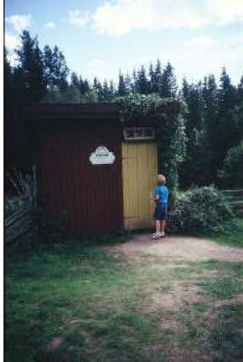
Benedikt vor einer Trissebude

Die Trissebude, das Plumpsklo, trifft man in Småland immer wieder an. In dieser oder jener