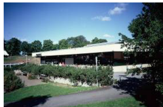
Die Stadtbibliothek in Västervik

Ergänzend dazu begeisterte uns auch die Buchhandlung in Västervik. Auch hier mussten wir nicht wirklich nach Astrid Lindgren-Büchern suchen. Und die entsprechenden Kassetten gab es ebenfalls.